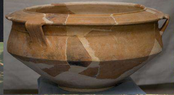
Знахідки з розкопок курганів пізньосарматського часу в с. Катемірівка. Розкопки М. Я. Рудинського, 1929 р. Фонди ПКМ.