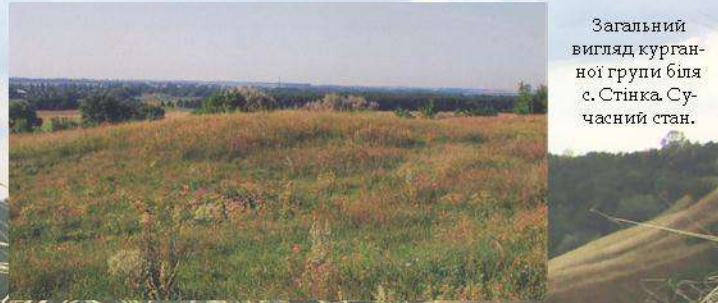
Загальний вигляд курганної групи біля с. Стінка. Сучасний стан.