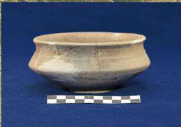
Миска, Черняхівська культура, Катемірівка. Розкопки Є.В. Махно, 1952. Фонди ПКМ.

Польові сезони 1948-1950 рр. Г.О. Сидоренко провела в експедиціях Інституту археології АН УРСР, очолюваних Євгенією Володимирівною Махно. Вона розгорнула роботи на поселенні та могильнику черняхівської культури в Катемірівці. Ці роботи тривали майже десятиліття – 1952, 1957, 1960-му рр.