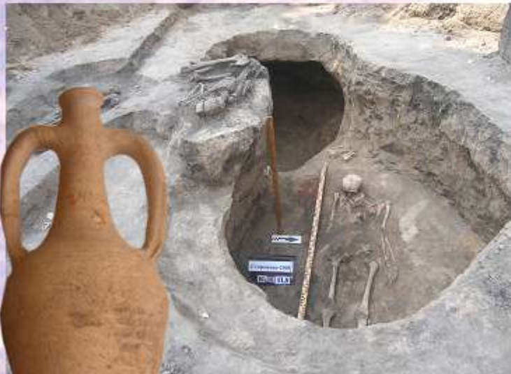
↑ Поховання катакомбної та зрубної культур. Сторожове. Розкопки Коваленко О.В. 2008.

На сьогодні вже досліджено 4 курганоподібних насипи, 9 пізно сарматських поховань кінця IV ст. до н.е., три кургани епохи середньої-пізньої бронзи (катакомбної, бабинської, зрубної культур). Розкопки могильника тривають.