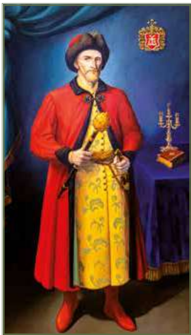
Портрет гетьмана Івана Мазепи. Худ. В. Побоків, н., о. 2021 р. Portrait of hetman Ivan Mazepa. By V. Pobokov, oil on canvas. 2021.

Ідея здійснити похід проти Дніпровських фортець належала козацькій старшині та особисто гетьману Івану Мазепі, котрі тривалий час виношували думку організації масштабної військової операції із протидії наступу Оттоманської Порти. Гетьман Іван Мазепа намагався врахувати недоліки та невдачі двох попередніх Кримських походів, для чого відмовився від військових дій на Кримському півострові, зосередившись на підступах до нього – чотирьох турецьких фортецях, що контролювали гирло Дніпра.