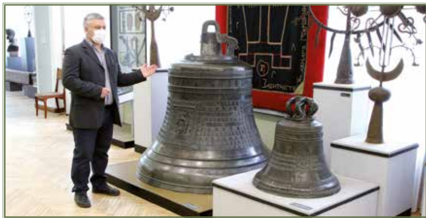
Дзвони «Кизи-Кермен» і Федора Жученка в експозиції залу № 10 музею. 2019 р. «Kyzy-Kermen» and Fedir Zhuchenko's bells in the exposition of hall 10. 2019.

Так дзвін Кизи-Кермен 1964 р. потрапив до експозиції зали № 10, котра розповідає про історію краю у XVIII ст., де його можна бачити і сьогодні (ПКМВК 13814, М 2789). Відвідувачі, напевне, вже й не зможуть уявити образ цього музейного простору без головного атрактивного експонату, пов'язаного з іменами плеяди історичних особистостей полтавської й загальноукраїнської історії – Івана Мазепи, Павла Герцика, Івана Величковського та багатьох інших.