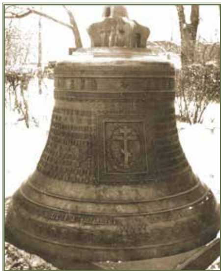
На подвір'ї музею. 1960 р. At the museum courtyard. 1960.

Дзвін прикрашений зображенням герба полтавського полковника Павла Герцика (сподвижника гетьмана Івана Мазепи, тестя гетьмана України у вигнанні Пилипа Орлика), Хреста, Божої Матері та уже згаданим написом із поетичним твором Іоанна Величковського – пам'яткою давньої української літератури. Виготовлений із мідного сплаву, його маса – 119 пудів 36 фунтів або 1965,6 кг, висота – 155 см, діаметр в основі – 153 см.