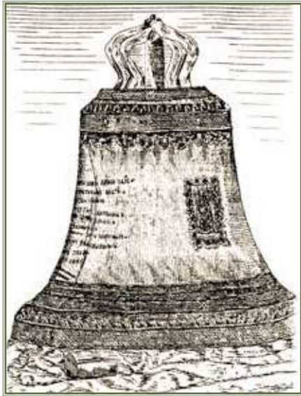
Дзвін «Кизи-Кермен» до переливання.

Зважаючи на тривалу історію козацької реліквії та художні якості оформлення, дзвін Кизи-Кермен виступає унікальною пам'яткою