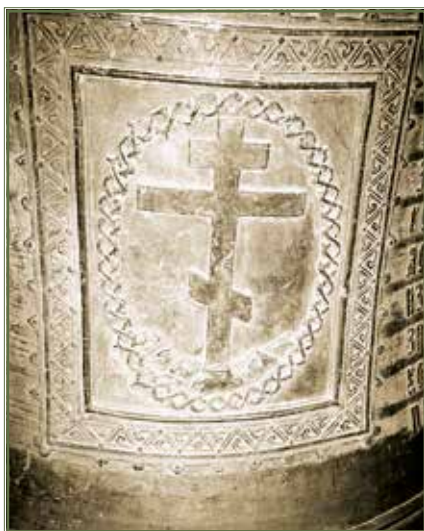
Дзвін «Кизи-Кермен». Фрагмент із зображенням хреста. «Kyzy-Kermen» bell. Fragment with image of cross.

До 1930 р. козацька реліквія знаходилася на дзвіниці Полтавського Успенського собору, звідки її скинули більшовики-богоборці та через що дзвін отримав пошкодження. Після цього його відвезли на склад «Рудметалторгу» і мали переплавити. Саме з цього складу славетний дзвін було викуплено Полтавським державним музеєм за 550 карбованців, а 15 січня 1930 р. його внесли до списку пам'яток ливарного мистецтва як об'єкт першої категорії. Однак пригоди