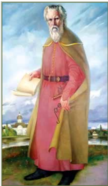
Портрет Самійла Величка. Худ. М. Підгорний, н., о. 2004 р. Portrait of Samiilo Velychko. By M. Pidhornyi, oil on canvas. 2004.

Найбільше відзначилися під час штурму і взяття Кизи-Кермена козаки Миргородського та Полтавського полків, очолювані полковниками Данилом Апостолом (1654–1734) і Павлом Герциком (1630-