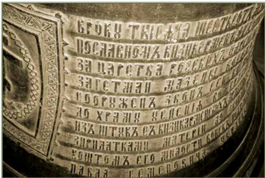
Дзвін «Кизи-Кермен». Фрагменти: зображення Божої Матері та герба полковника Павла Герцика. Текст вірша Іоанна Величковського. «Kuzu-Kermen» bell. Fragments: image of Virgin Mother and emblem of colonel Pavlo Hertsyk. Text from the poem by Ioann Velychkovskyi.