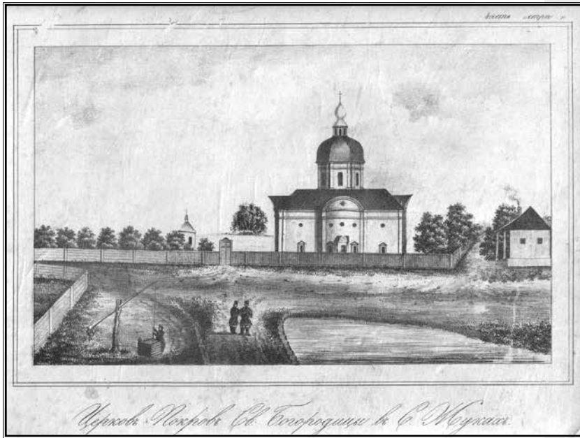
Покровська церква у с. Жуки. Малюнок козака Чапіги. 2-га чв. XIX ст. Protection Church in Zhuky Village. Drawing by Cossack Chapiha. The second half of the 19 th c.