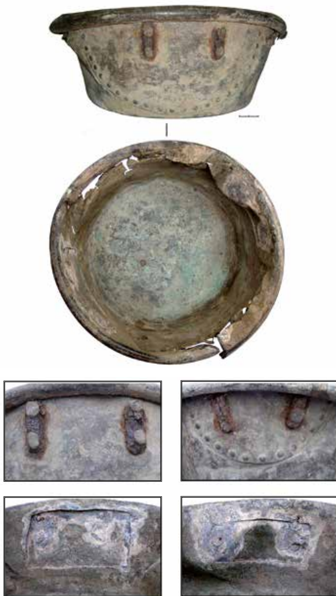
Рис. 2. Лівенське, с., Сишенкове, ур. Казан. Мідний сплав, залізо. Livenske Village, Shyshenkove Stow. Caldron. Copper alloy, iron.