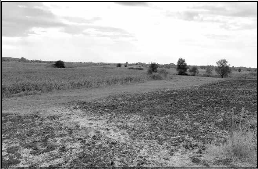
Лівенське, с., Сишенкове, ур. Місце знахідки «скарбу». 2024 Livenske Village, Syshenkove Stow. Place of «treasure» finding. 2004.