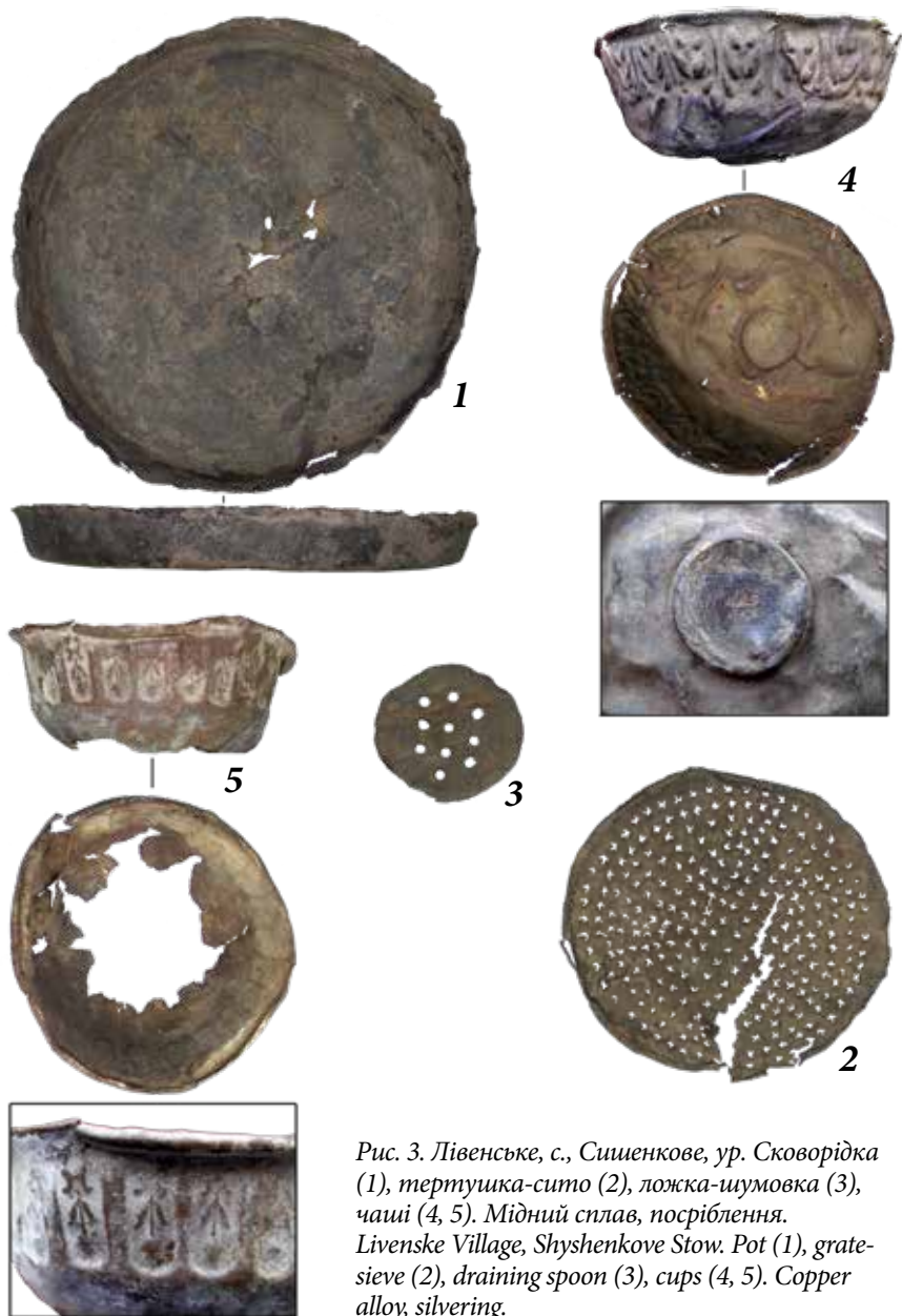
Рис. 3. Лівенське, с., Шишенкове, ур. Сковорідка (1), тертушка-сито (2), ложка-шумовка (3), чаші (4, 5). Мідний сплав, посріблення. Livenske Village, Shyshenkove Stow. Pot (1), grate-sieve (2), draining spoon (3), cups (4, 5). Copper alloy, silvering.