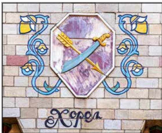
12. Герб Хорольського повіту на фасаді будинку Полтавського краєзнавчого музею імені Василя Кричевського. Emblem of Khorol District at the façade of the Vasyl Krychevsky Poltava Local Museum building.

Різьбяр намагався наносити зображення симетрично. Симетрія виконувала організуючу функцію в композиції, але, як і загалом у на-