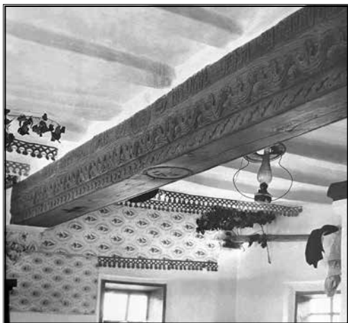
15. Сволока 1741 р. у хаті с. Жовнин. Фото поч. XX ст. з архіву Костя Моценка, що зберігається в Ukrainian History and Education Center (New Jersey, USA). Ceiling beam of 1741 in house in Zhovnyne Village. Photo from archive of Kost Moshchenko, preserved in Ukrainian History and Education Center (New Jersey, USA).

на демонтаж головної балки. Адже для цього потрібно було руйнувати стелю.