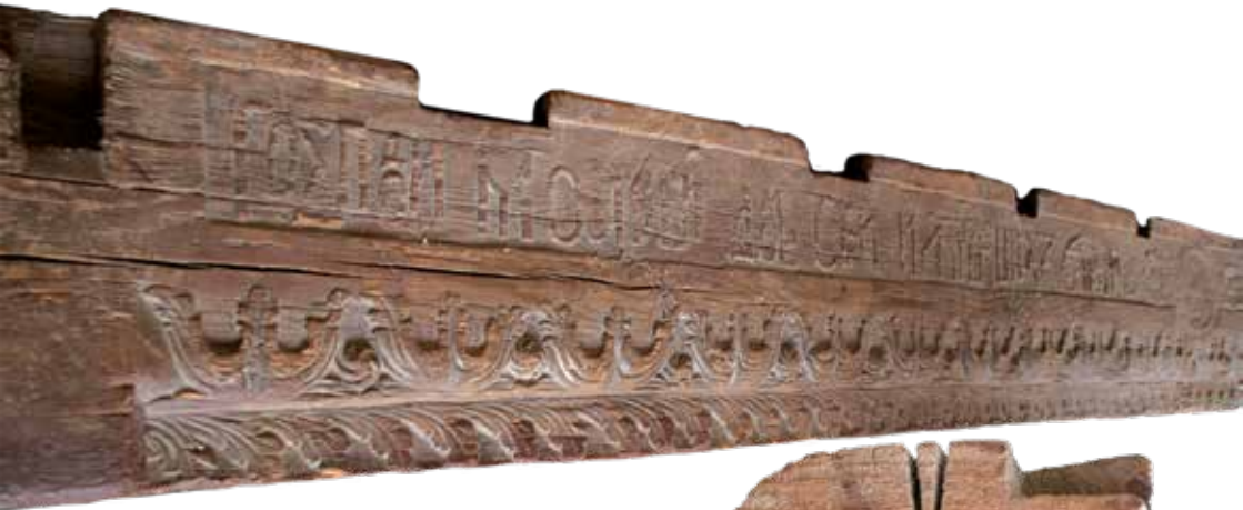
3. Сволук із с. Жовнини. Сучасний вигляд.

Ceiling beam from Zhovnyne. Recent view.