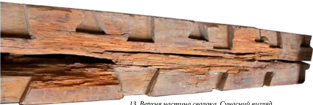
13. Верхня частина сволока. Сучасний вигляд. Upper part of ceiling beam. Recent view.

Середина кімнати очевидно була «митюю». Тобто, дерево не штукатурили й не білили. Край сволока, що виходив назовні будинку, мав хрестоподібну форму (рис. 14). Подібні декоративні й оберєгові елементи екстер'єру досі можна побачити в хатах із Західної України, що експонуються в Музеї архітектури і побуту імені Климента Шептицького у Львові.