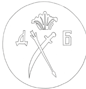
10. Промальовка герба на сволоці. Trace drawing of an emblem at ceiling beam.