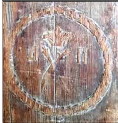
9. Герб на сволоці. Сучасний вигляд. Emblem at ceiling beam. Recent view.

Уважаємо, що фундатором хати, з якої походить сволок, був Дем'ян Булюбаш. Відмінність написання прізвища може пояснюватися різними причинами. Наприклад тим, що людина, яка готувала текст, записала його на слух. Важливо, що Дем'ян був, за родовою легендою, онуком особи із прізвиськом Булюк-Паша. Тобто, прізвище в усному мовленні могло звучати дещо відмінно від того, як писалося в документах. Батько Дем'яна Іван був шляхтичем. Під час перебування на Правобережжі Дніпра – охотницьким полковником. Переселившись на Лівобережжя наприкінці XVII ст., він став Чигирин-Дібровським сотником, мешкав у Жовниному. Булюбаші мали помістя в цьому містечку і в XIX ст. Мати Дем'яна, донька останнього гетьмана Війська Запорізького на Правобе-