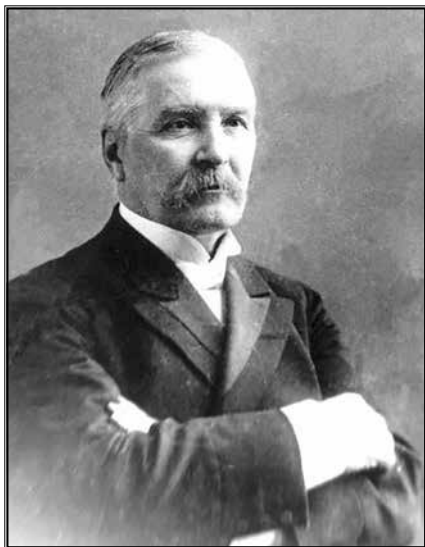
11. Микола Лисенко (1842 – 1912).