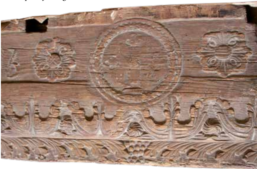
5. Центр сволока. Сучасний вигляд. Central part of ceiling beam. Recent view.

Верхня смуга складається із розділеного медальйоном і двома восьмипелюстковими хрестоподібними розетками (рис. 5) опуклого церковно-слов'янського напису в один ряд (текст подано із розкритими скороченнями): «ГОСПОДИ БЛАГОСЛОВИ ДОМЪ СЕЙ И ЖИВУЩИХЪ В НЕМЪ БЛАГОСЛОВЕНИЕ СВЯТЫЯ ТРОИЦЫ СОЗДАСЯ ДОМЪ ПНОМ ДИМЯНОМ БУЛИПОШЕМ РОКУ» (рис. 6–7). Це формулювання є унікальним для українських сволоків, але канонічним за змістом. Під крайнім словом міститься дата – «1741», а під нею –