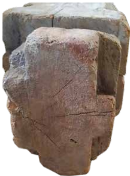
14. Зовнішній торець сволока. Сучасний вигляд. Front face of ceiling beam. Recent view.

За інформацією із запису в «Каталозі історико-етнографічного відділу природничо-історичного музею Полтавського губернського земства», сволок на час знаходження перебував у селянській хаті, куди «очевидно був перенесений після руйнування панського будинку». М. Сварник віднайшла фото інтер'єру цієї хати в архіві К. Мощенка (рис. 15), котрий зберігається в Ukrainian History and Education Center (New Jersey, USA). На ньому помітно, що планування світлиці зі сволоком було типове для традиційного будівництва житла українців Наддніпрянщини. Балка розміщувалася лицевою частиною до «публічної» зони кімнати (помітний верхній кут шафи). За зворотом розташовувалася піч, піл та жердина із одягом. Хата належала заможному селянину, про що свідчить ошатність внутрішнього простору (шафа, гасова лампа, витинанки і шпалери). Тому можна лише уявити, скільки зусиль довелося докласти Костю Мощенку, щоб власник хати погодився