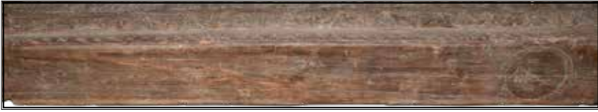
8. Нижня частина сволока. Сучасний вигляд. Lower part of ceiling beam. Recent view.

Цей варіант прочитання прізвища міститься і в найдавнішому описі артефакту – «Каталозі історико-етнографічного відділу природничо-історичного музею Полтавського губернського земства». Вказаний там рік створення сволока – 1740. Зараз нуль у даті не читається, а остання цифра схожа на одиницю.