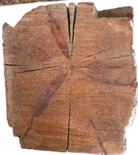
4. Переріз сволока. Сучасний вигляд. Sectional view of ceiling beam. Recent view.

Ceiling beam from Zhovnyne. Recent view.